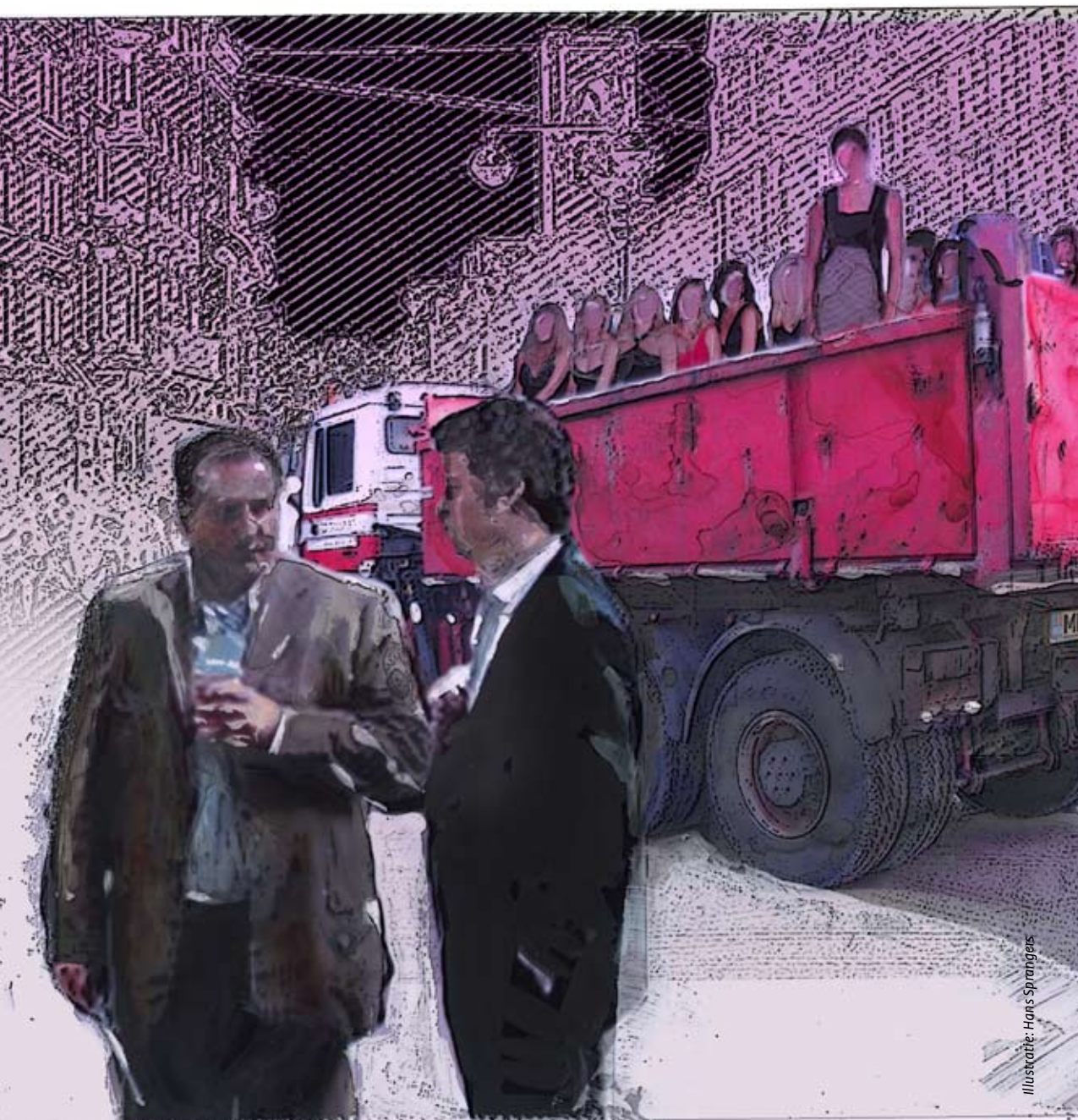
Illustratie: Hans Sprangers

Er wordt nogal eens geopperd dat de escortbranche – sinds de opheffing van het bordeelverbod – het ‘afvoerputje’ van de prostitutiesector is geworden. Maar is dat ook zo? Om daar zicht op te krijgen, liet de gemeente Amsterdam een onderzoek naar de plaatselijke escortbranche uitvoeren.