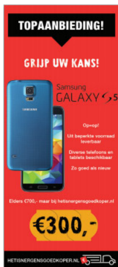
Figuur 2 - Voorbeelden van lokadvertenties.

In Deventer doet de politie onderzoek naar vier personen. Het gaat om twee dieven en twee helers waarvan vermoed wordt dat deze samenwerken. Een zoekslag in het DOR laat zien dat de goederen die deze twee helers aanbieden van vele inbraken afkomstig zijn. Verdere analyses maken het mogelijk de dieven en helers aan een nog groter aantal inbraken te koppelen. Mede dankzij het DOR worden hiermee honderd inbraken opgelost.